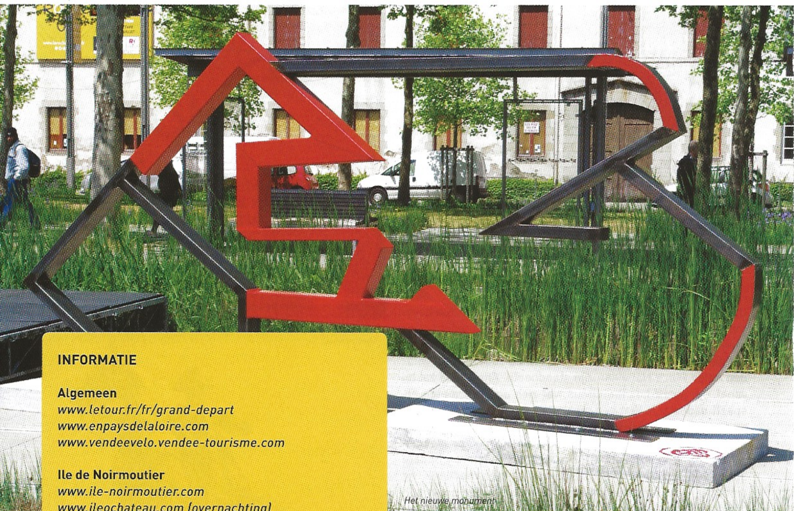
Het nieuwe monument